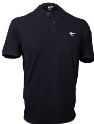
Polo azul e branco CEV