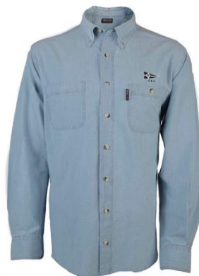
Camisa vaqueira celeste CEV