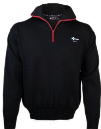
Jersey marinho azul CEV